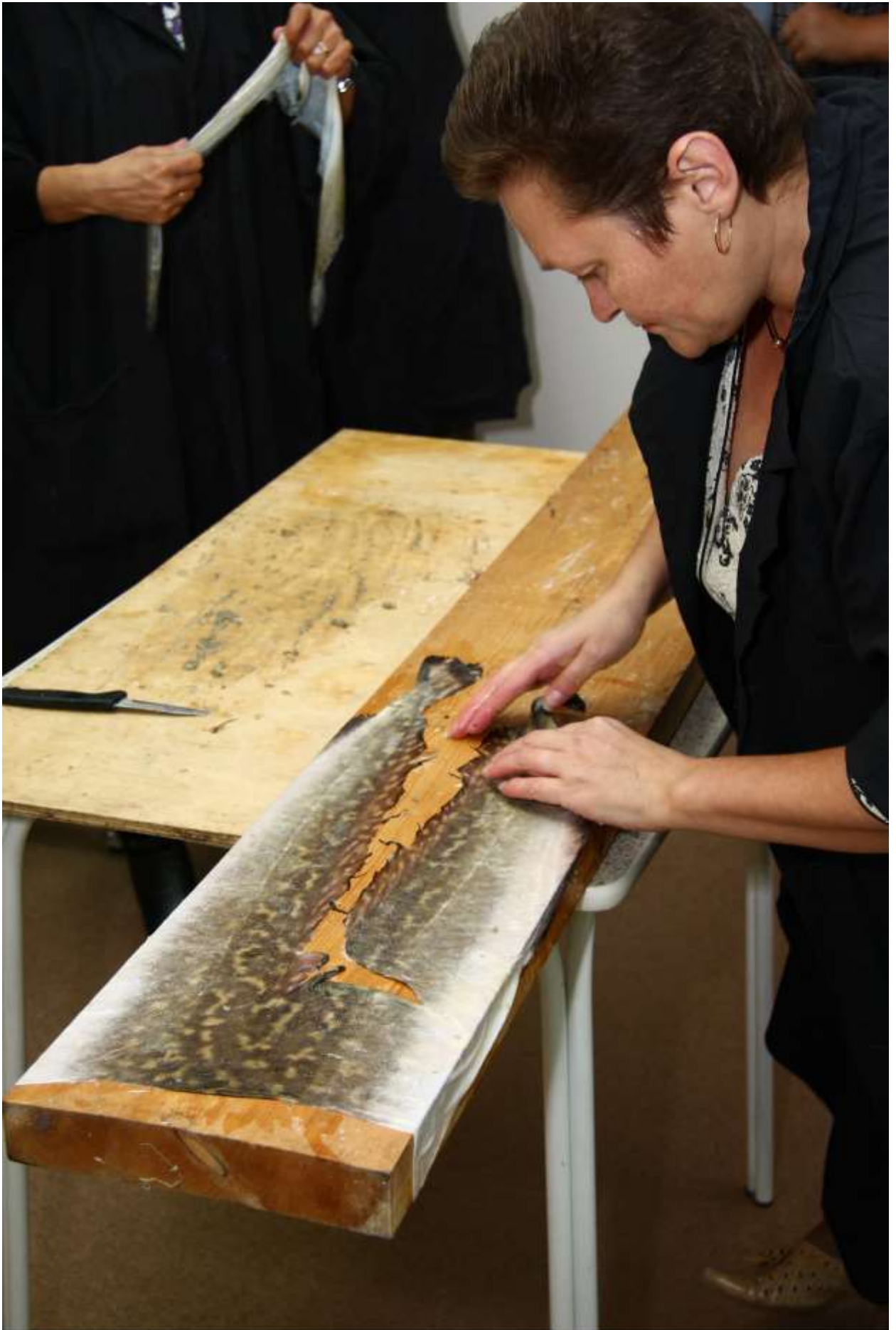
Накладываем кожу рыбы на доску для просушки