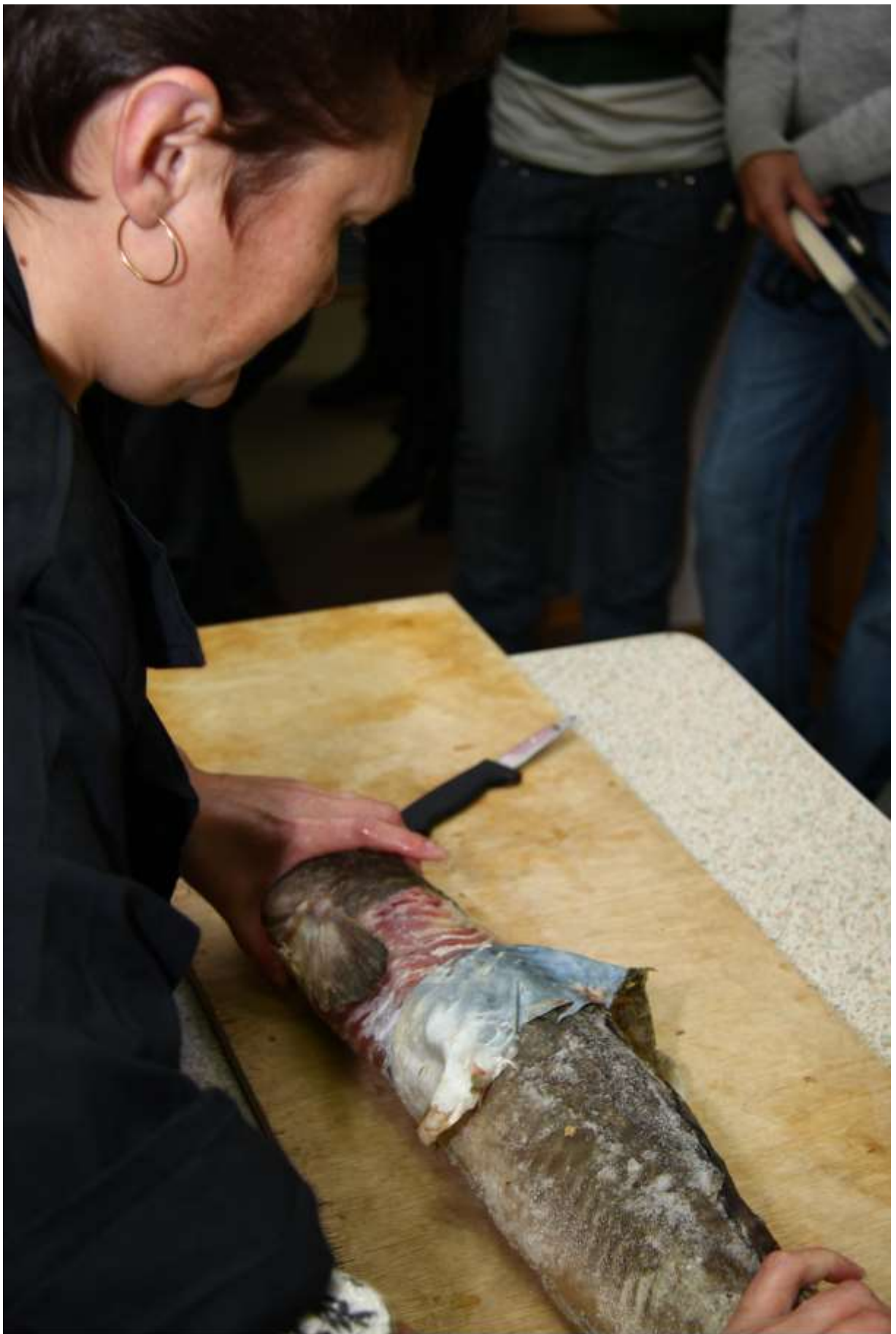
Кожу аккуратно отделяем от тушки руками