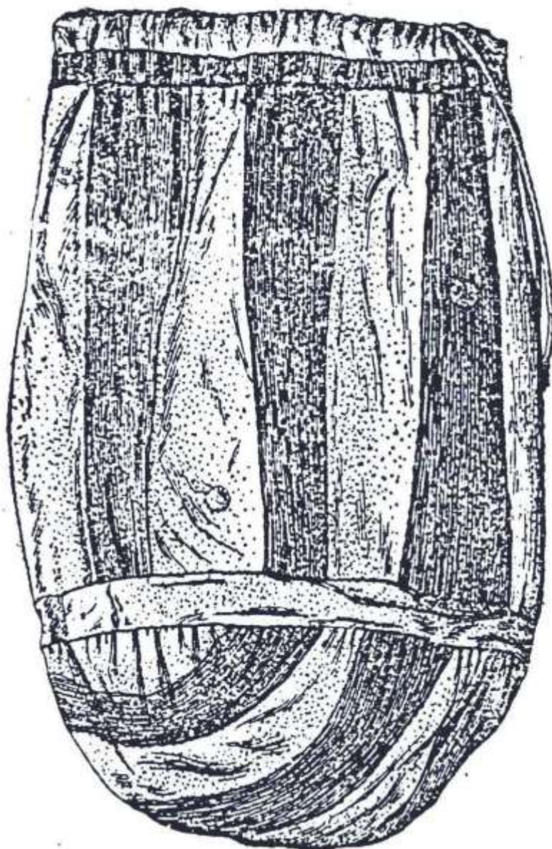
Рис. 2. Мешок из кожи налима. (МАЭ, колл. № 859-85).