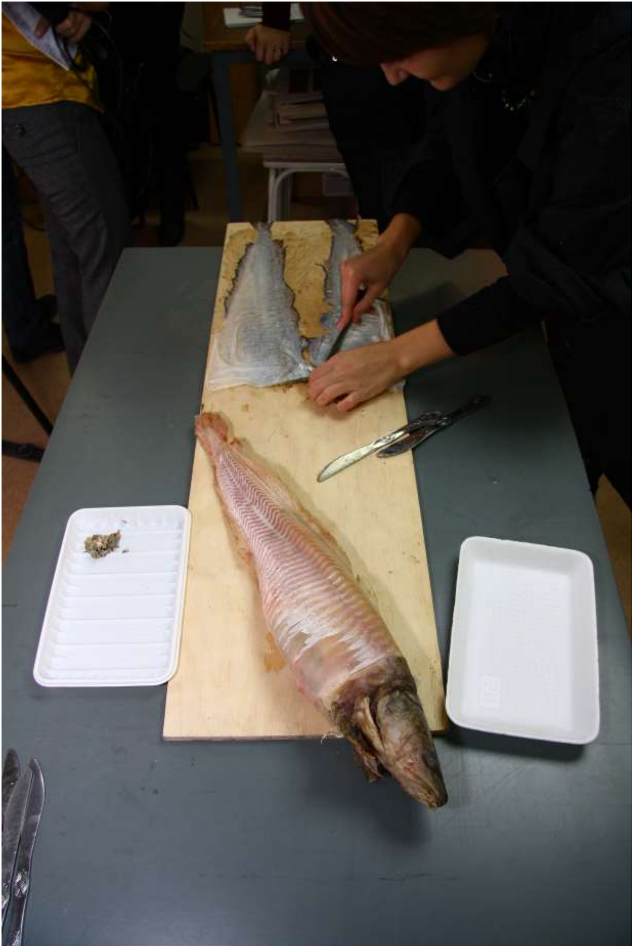
С внутренней стороны рыбьей кожи ножом снимаем остатки кусочков рыбы