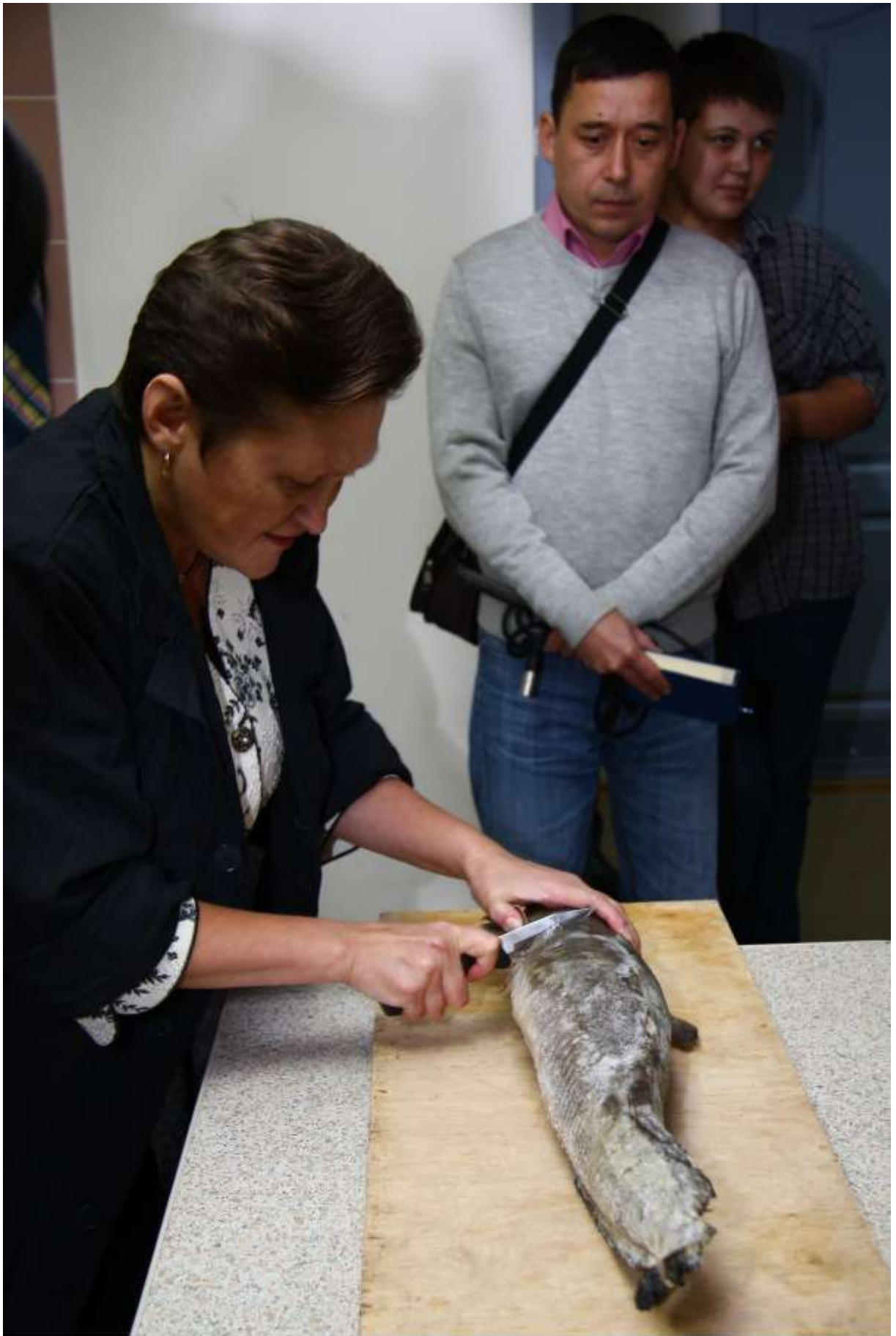
Делаем надрез вокруг головы рыбы