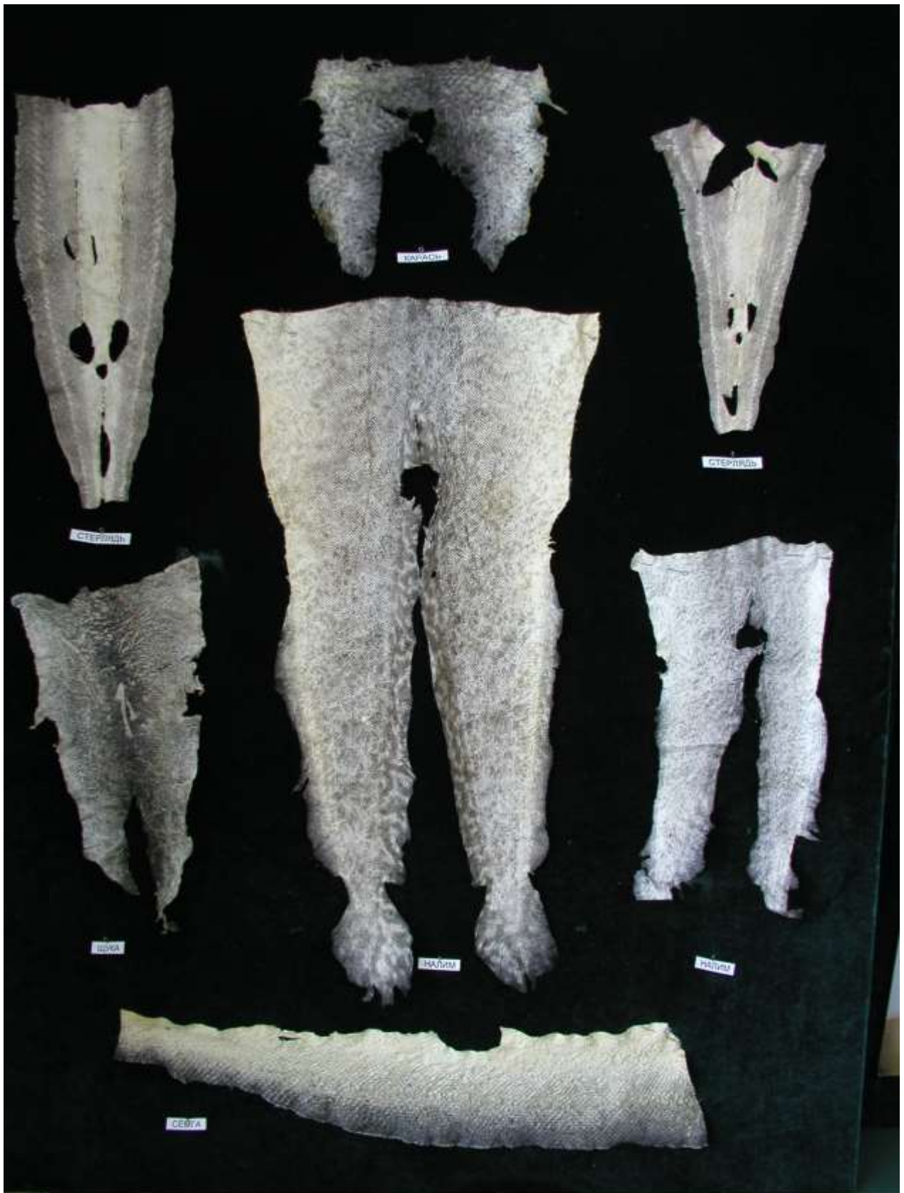
Фактура кожи различных рыб