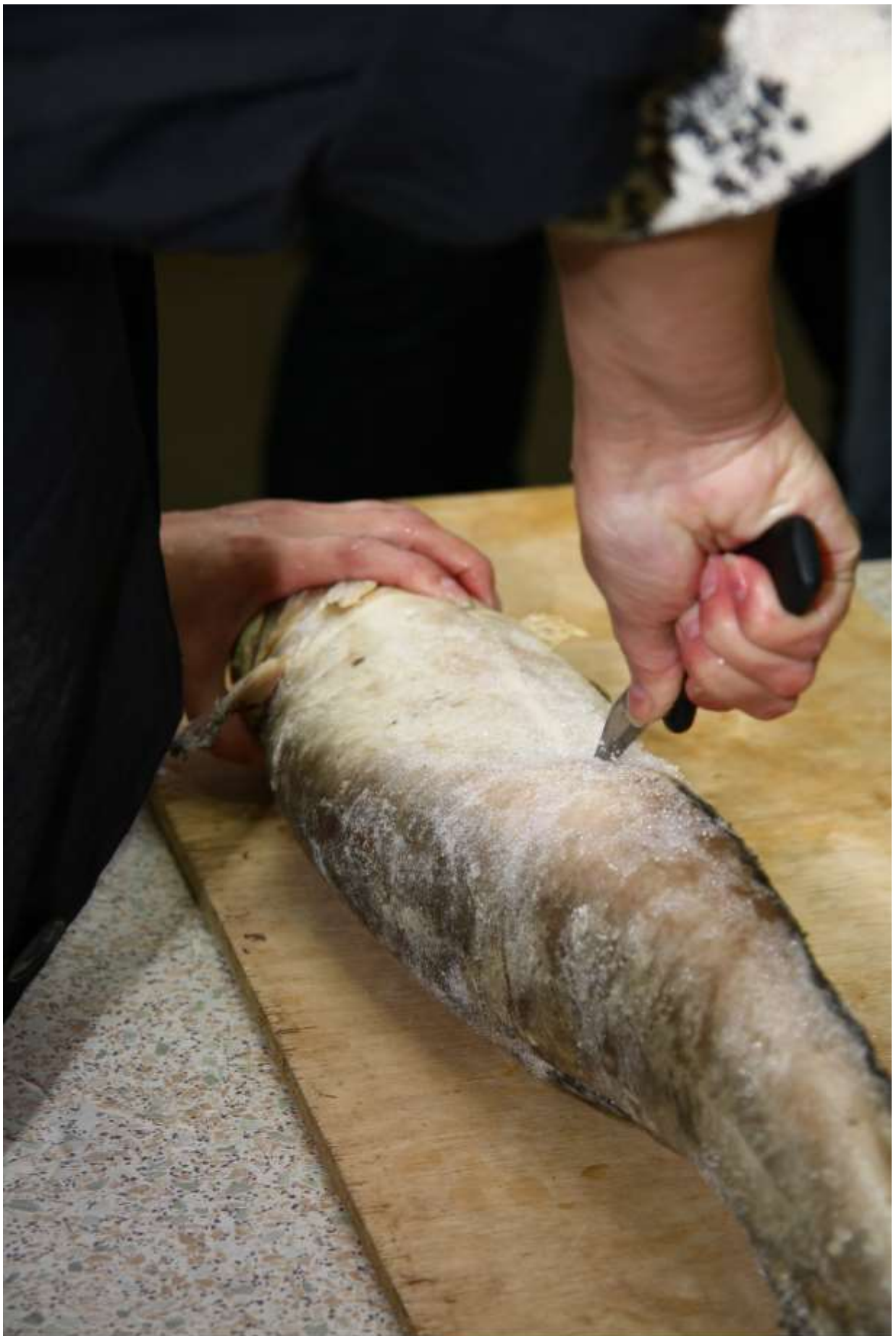
Делаем надрез от головы до хвостового плавника по брюху