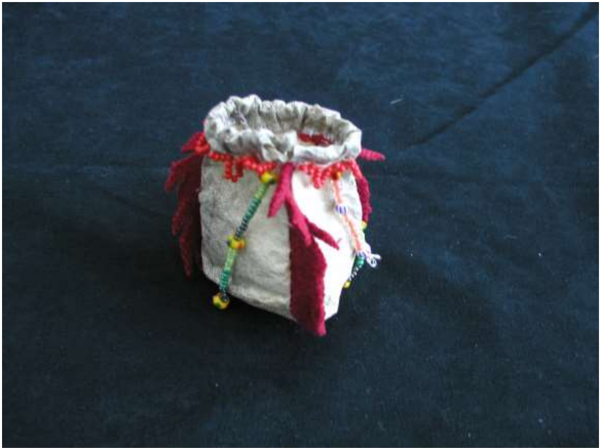
Тимербаева Джамиля, 12 лет, 2003 г. "Мешочек из кожи налима" кожа налима, сукно, бисер, нить х/б