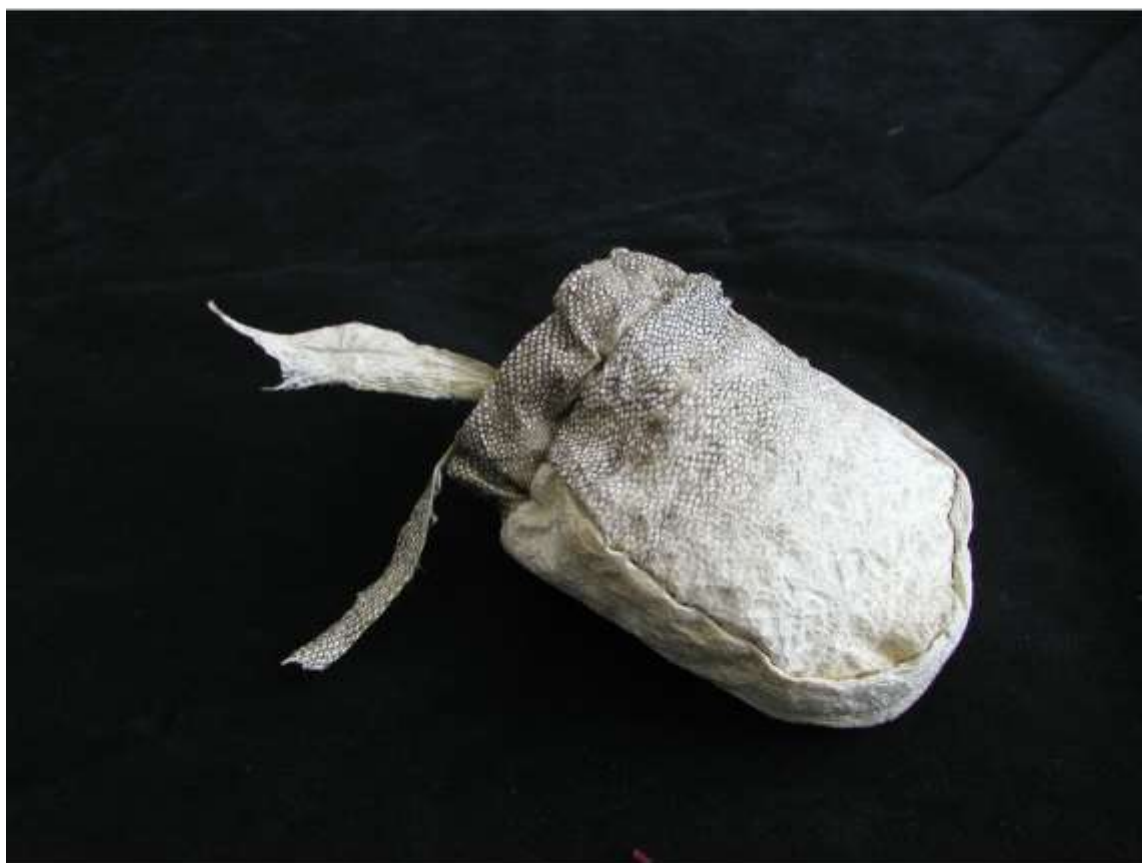
Сайнакова Н.Ю. 2003 г. “Мешочек из кожи налима” кожа налима, нить - сухожилие оленя