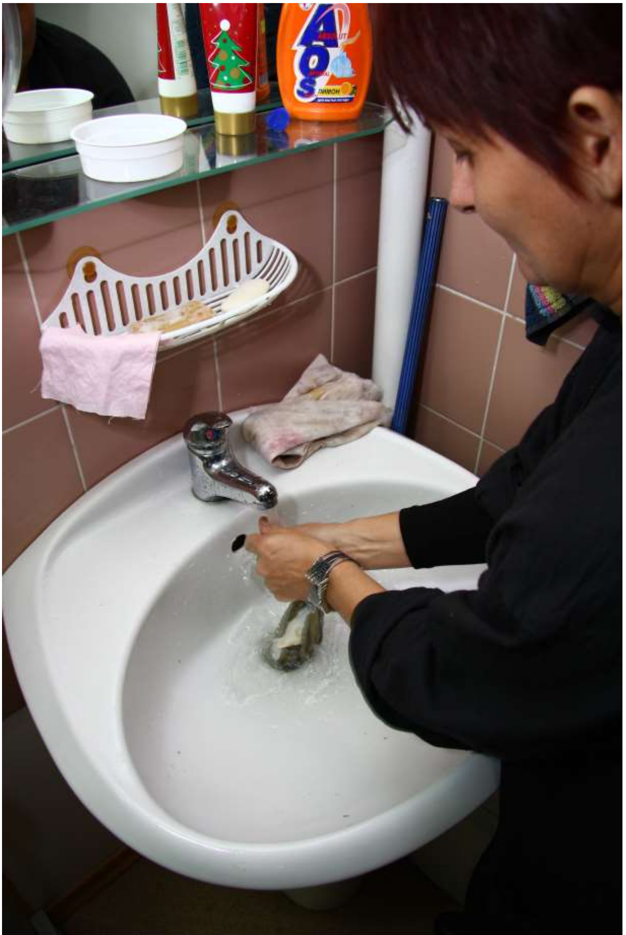
Обезжириваем мыльным раствором