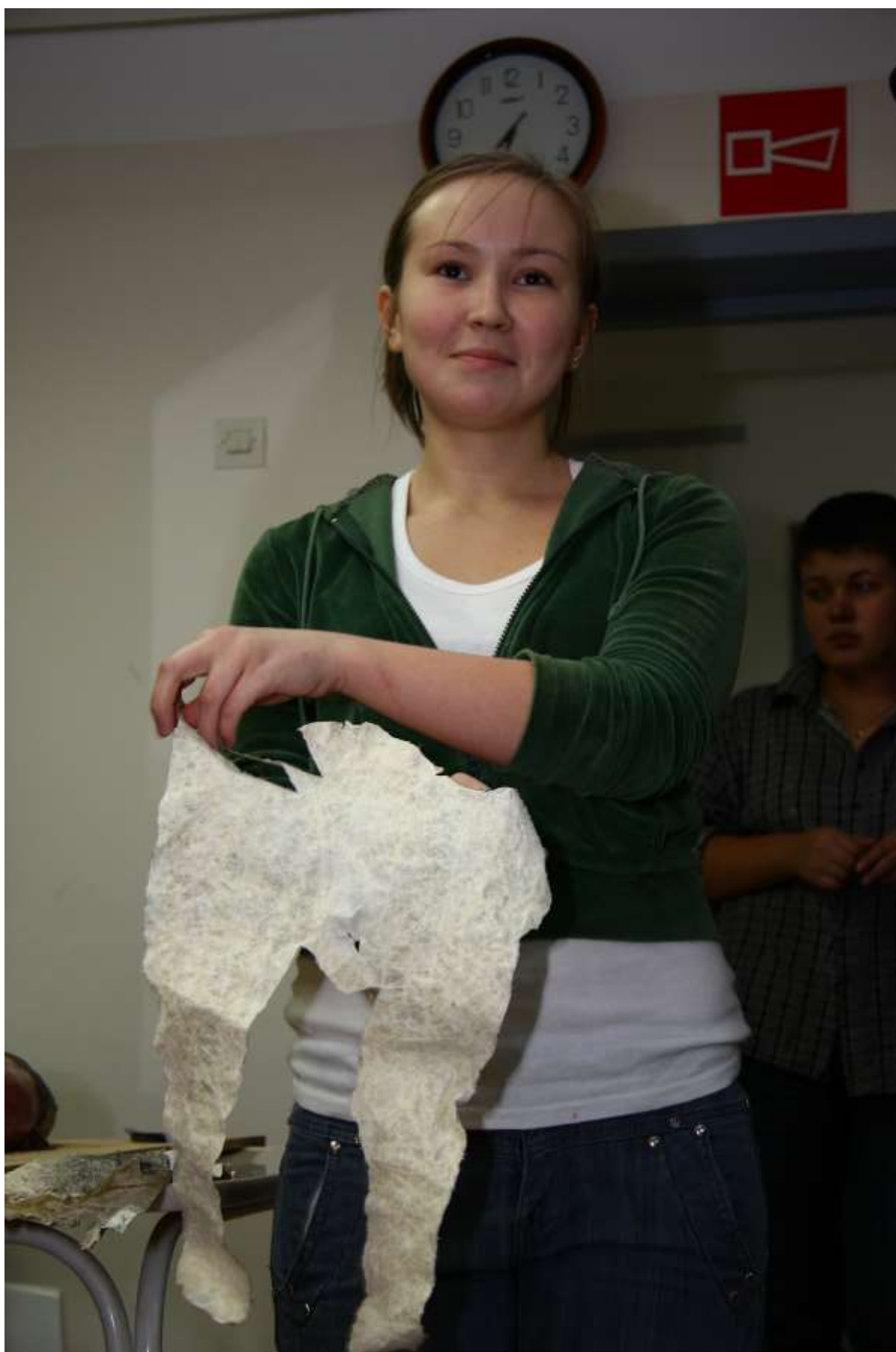
Выделяем рыбью кожу вручную круговыми движениями