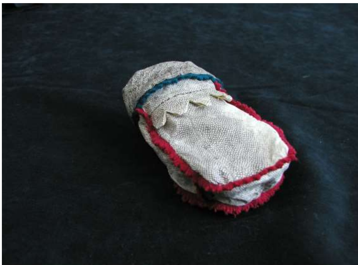
Сайнакова Н.Ю. 2003 г. “Мешочек из кожи налима” кожа налима, сукно, нить - сухожилие оленя