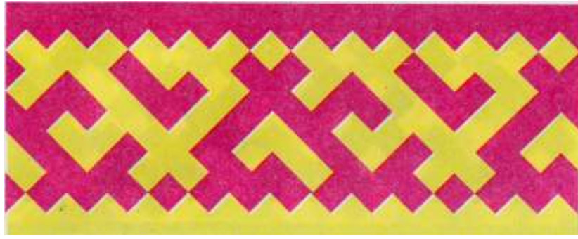
Морда для рыбной ловли