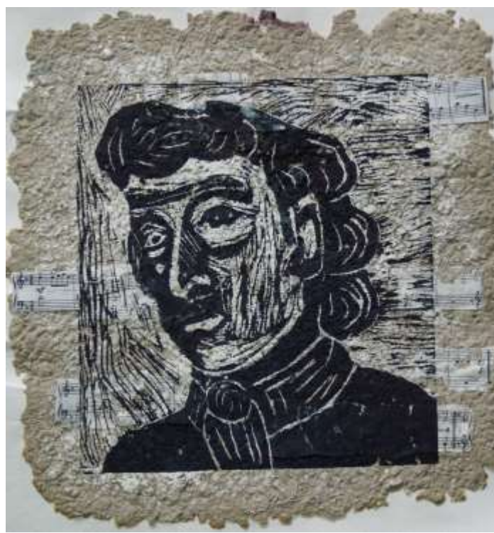
Бачкарёва Маша 13 лет «Шопен» б. собственного изготовления, офорт Приложение 7