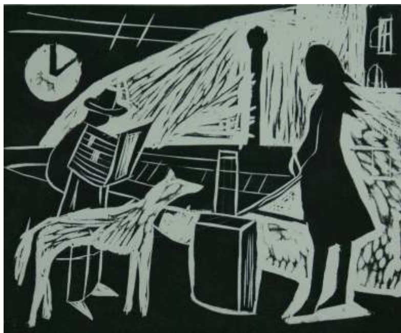
«Вокзал» б. офорт - Бахарева Вика 13 лет