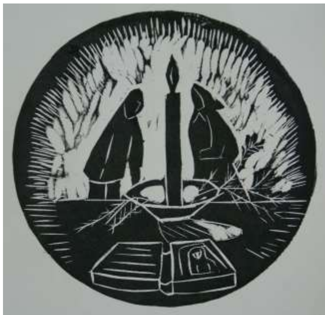
«Молитва»б. офорт - Бочкарёва маша 13 лет