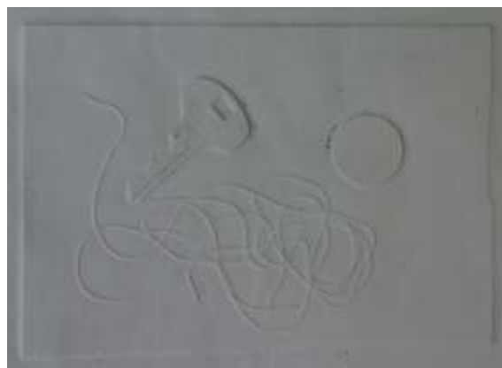
Оттиски предметов быта.