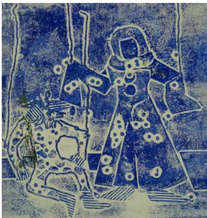
«Театр» б. офорт - Платонова Люба 13 лет