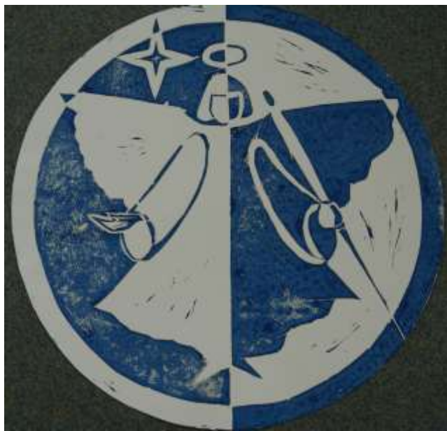
«Ангел»б. офорт - Бахарева Вика 13 лет