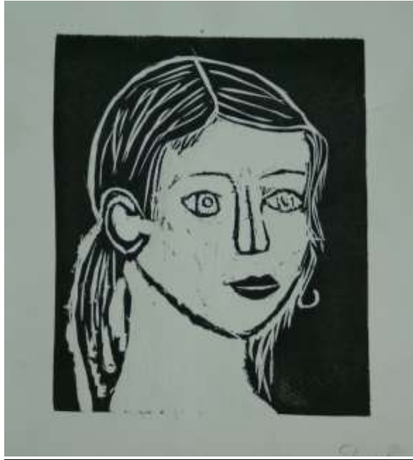
«Автопортрет» б. офорт - Диана