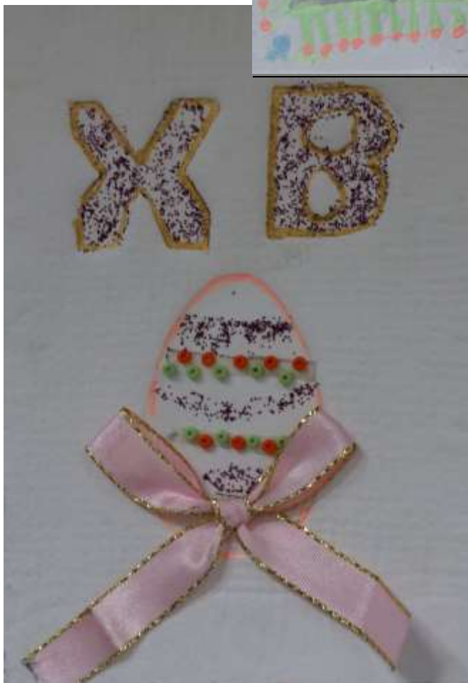
«Пасхальные открытки» оттиск, декоративное оформление. СОДЕРЖАНИЕ