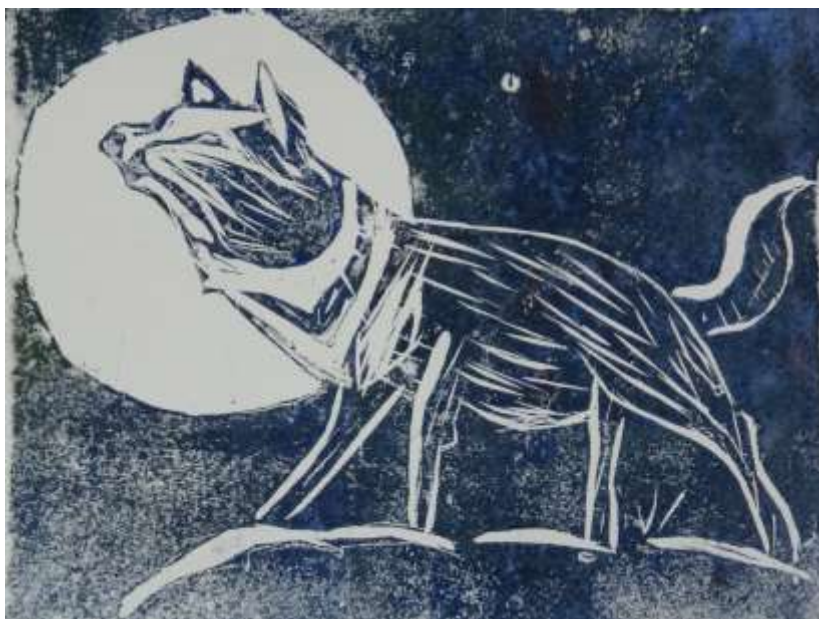
Ёлхина Даша 13 лет «Волк» б. офорт