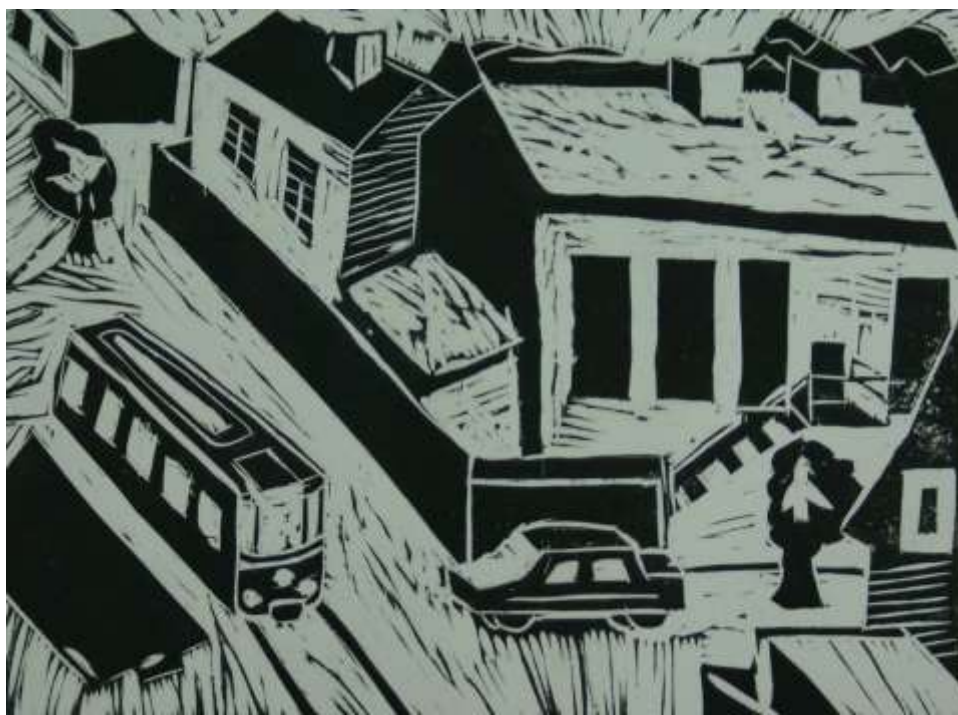
«Мой город» б. офорт - Чеканов Денис 14 лет