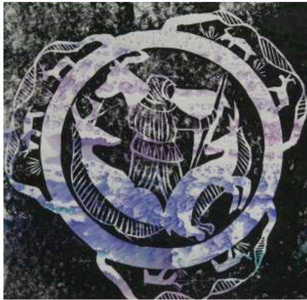
«Олени» б. офорт - Шахназаров Эльдар 14 лет