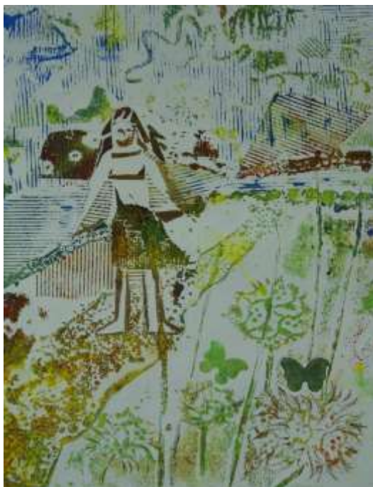
«Летом у бабушки» б. офорт