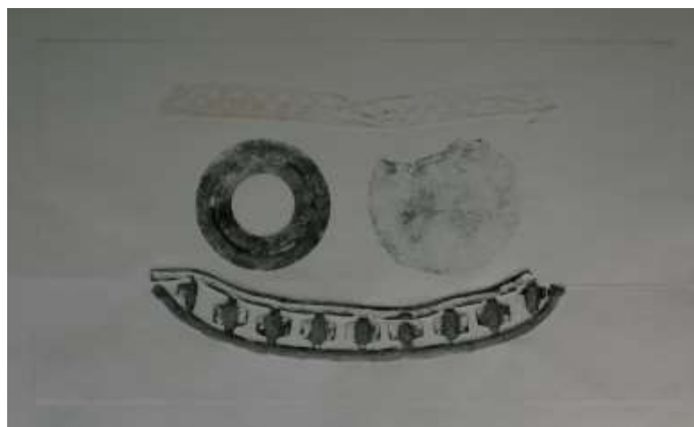
Оттиски из металла.