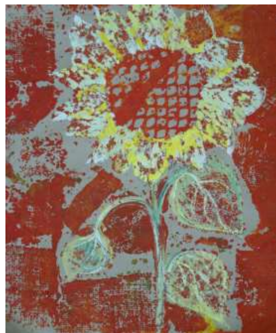
«Подсолнух» б. офорт